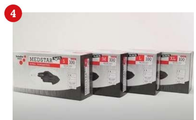
Medstar Black. – Eh'klar!