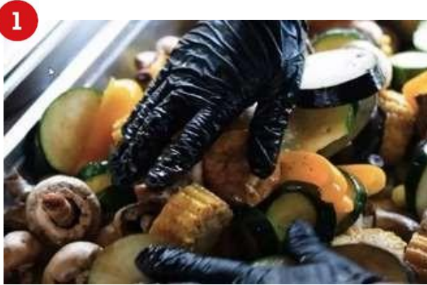
Fekete, egyszerhasználatos nitril kesztyű – élelmiszerrel való érintkezésre alkalmas...